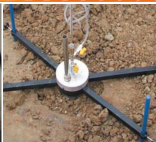
Permeametro di Boutwell