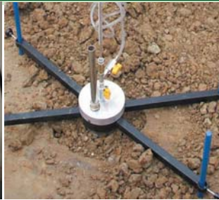
Permeametro di Boutwell